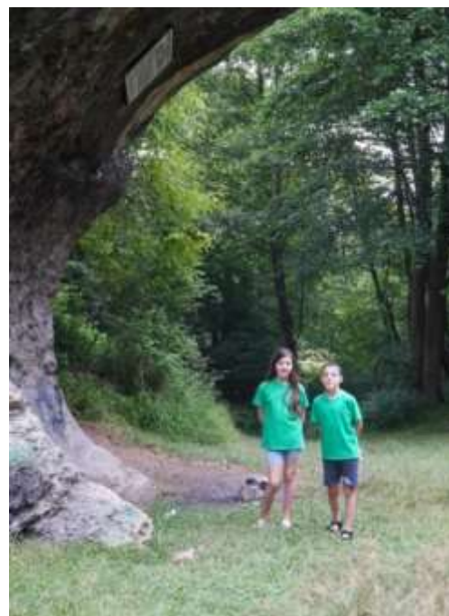
Ausflug zum Halben Stein im Silberbachtal