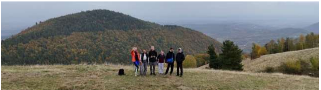
Wanderung auf die Fraga in die Hermannstädter "Mărginime"