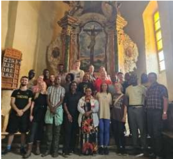
Besuch der Jugendgruppe aus Tansania und Westfalen am Diakoniehof Schellenberg

Als Pfarrer stehe ich auch im Dienst des Übergemeindlichen. Wichtig sind hier die monatlichen Pfarrversammlungen auf Bezirksebene, die Pfarrklausuren der Landeskirche und mein Dienst im Jugendwerk, wo ich als Zensor fungiere. Nach Möglichkeit nehme ich an verschiedenen kirchenbezogenen Veranstaltungen teil,