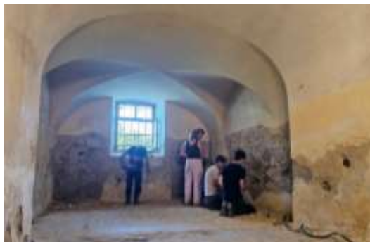
Freiwillige und Bewohner des Diakoniehofs helfen mit, in der Kirche feuchten Verputz abzuklopfen, nachdem Fachleute die Wände vorher geprüft hatten.