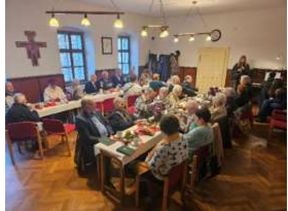
... und im Pfarrhaus am Huetplatz