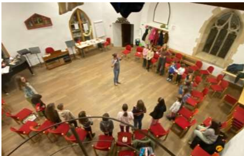
Probe des Kinderchores in der Loge