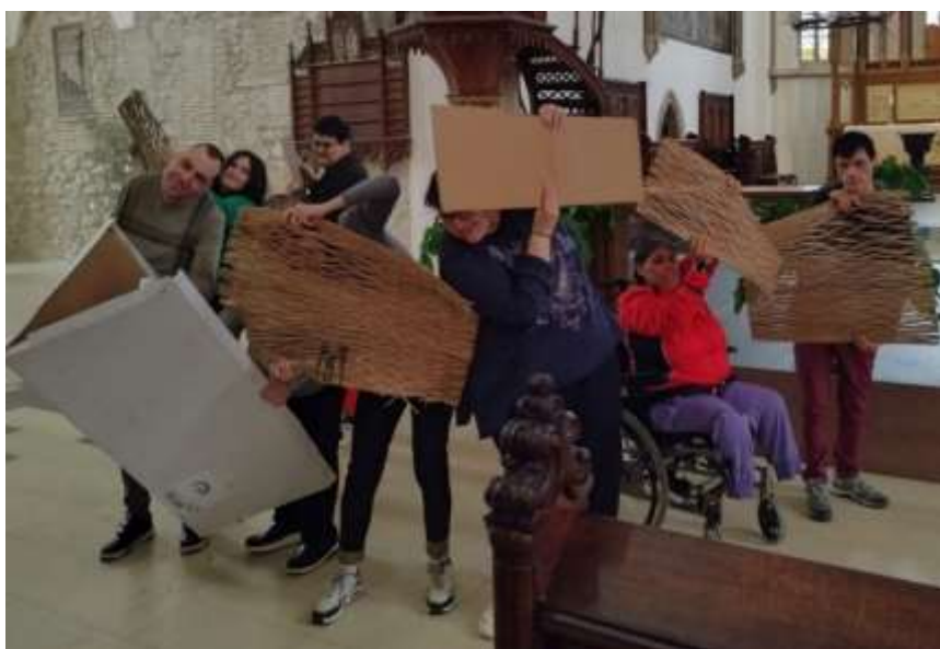
Compañia DisPlace bei der Probe in der Stadtpfarrkirche