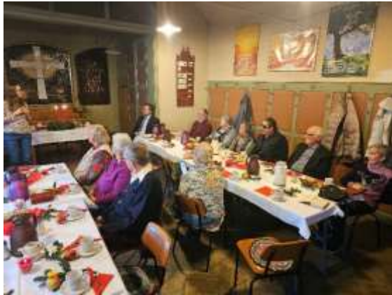
Adventkaffee im Gemeinderaum Hippodrom

Die diakonische Arbeit konzentrierte sich 2025 auf die Unterstützung von Menschen in schwierigen Lebenslagen, die Begleitung älterer Gemeindemitglieder sowie den Ausbau bestehender Angebote. Der Bericht gibt einen Überblick über Strukturen, Maßnahmen und Kennzahlen des vergangenen Jahres.