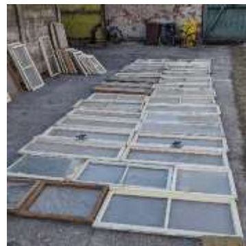
Alte Fenster werden für das Gewächshaus zusammen ausgelegt

Fertigstellung der Elektroinstallation, so dass das gesamte Anwesen von der Solaranlage versorgt werden kann.