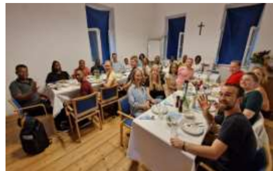
Besuch einer Jugendgruppe aus Tansania und Deutschland am Diakoniehof