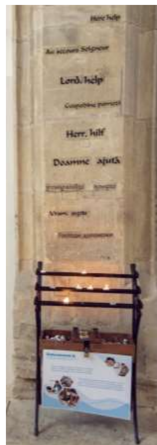
Der Gebetsleuchter in der Stadtpfarrkirche - wird jede Woche frisch von der Werkstatt bestückt