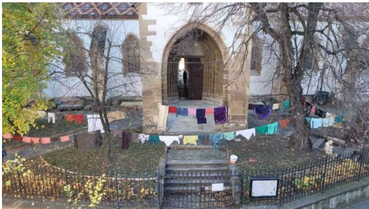
Die Kostüme für das Krippenspiel werden sortiert, gereinigt und auf der N-Seite der Kirche zum Lüften aufgehängt - das bunte Bild hat uns einen Zeitungsartikel eingebracht

Stadtpfarrer Kilian Dörr und Kuratorin Ilse Philippi