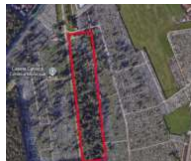
1Das Resultat von 25 Jahren Baumpflanzaktionen auf dem evangelischen Teil lässt sich mittlerweile vom google-maps-Satelliten beobachten

In aufwendiger Kleinarbeit hat Frau Antonia Gallotsik eine Situation erfasst, aus der die aktuelle Lage der „HdH-Taxenzahler“ ersichtlich ist. Eine Übersicht über die Tabelle ergibt folgende Sachlage: Es werden 668 aufgelistet, davon werden für rund 110 Gräber keine Taxen mehr bezahlt. Die Gründe dafür sind verschieden. Es gibt seit 2025 auch „Wiederzahler“ (5 Grabstätten). Eine Treue spendete 590€ zu Friedhofszwecken in Hermannstadt.