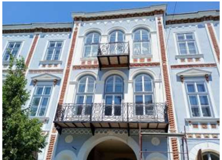
Die Fassade des Hauses Reispergasse / Avram Iancu 11 enthält auf jedem Stockwerk Ornamente, die den Aufbau der Welt von den Mineralstoffen über Pflanzen und Tiere bis zu den Menschen hin symbolisieren.

Umfassende Fassadenrenovierung Richtung Straße, Dachreparaturen mit Wandergesellen, Renovierung der Whg. Bucur inkl. neuer Heizkessel, administrative Verfahren, um die Geschäftslokale ihrer aktuellen Nutzung entsprechend einzutragen.