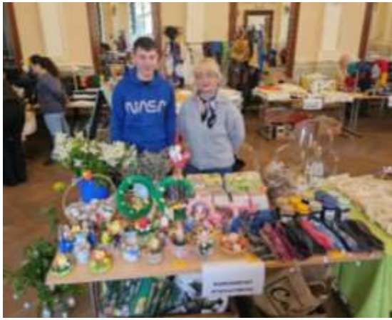
Stand des Diakoniehofs am Osterbasar im Spiegelsaal

Die Betreuten nahmen zudem mit den Produkten des Diakoniehofs an Basaren teil und beteiligten sich am sozialen Leben.