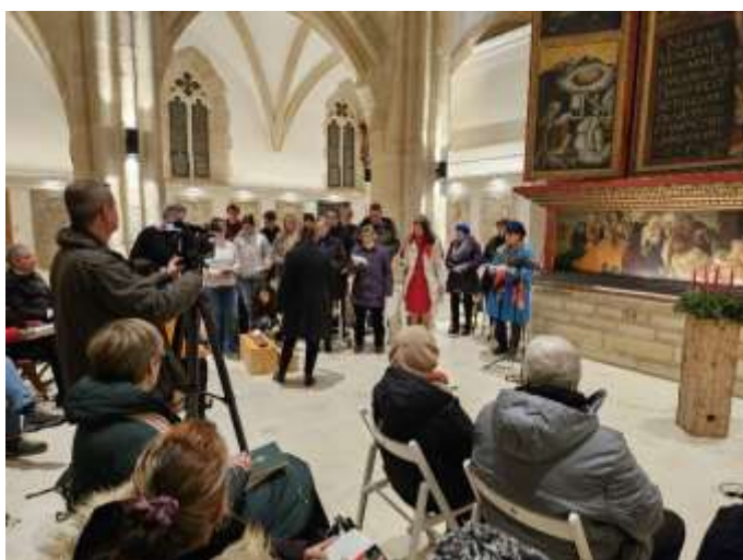
Offenes Singen zum Auftakt der Gesangbuch-Ausstellung