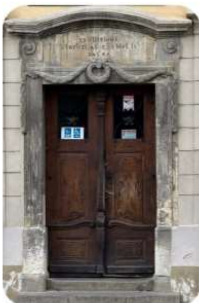
Die Mittel für die Restaurierung des Hauptportals der Brukenthalschule durch ein Projekt der Kirchengemeinde konnten unter den Absolventen gesammelt werden

Nach der Wende wurde das Gebäude des Brukenthalgymansiums unserer Kirchengemeinde rückerstattet. Das alte Gebäude muss grundlegend saniert werden. Da die von der Stadt gezahlte Miete dafür nicht ausreichte, entschied man zusammen, für die Sanierung ein EU-Projekt anzugehen. Dafür hat die EKH als ersten Schritt für die Renovierung die kostenintensive Genehmigungs-Planung übernommen und die sog. DALI ( Documentația de Avizare a Lucrărilor de Intervenție ) aufstellen lassen. Das Projekt selber wird vom Bürgermeisteramt beantragt, wobei die Kirchengemeinde zuarbeitet. Damit das möglich sein konnte, wurde zwischen der EKH und dem Bürgermeisteramt ein mietfreier Nutzungsvertrag für 15 Jahre abgeschlossen. Da so ein EU-Projekt in der Finanzierung zurzeit noch unsicher ist und sich in die Länge ziehen kann, möchte die Kirchengemeinde trotzdem ein Zeichen setzen, dass ihr diese Schule am Herzen liegt. So hat sie die Restaurierung des Portals der Schule übernommen, und aufgrund eines Kostenvoranschlags einer lokalen Stein-Restauratorin im Mai 2025 ein Crowd-Funding-Projekt gestartet. Auf den Flyer reagierten besonders die Bruk-Absolventen, die zu den Klassentreffen zusammenkamen, einer von ihnen übernahm fast die Hälfte der benötigten Mittel, so dass erfreulicherweise bereits im Oktober die nächste Phase der Restaurierung starten konnte.