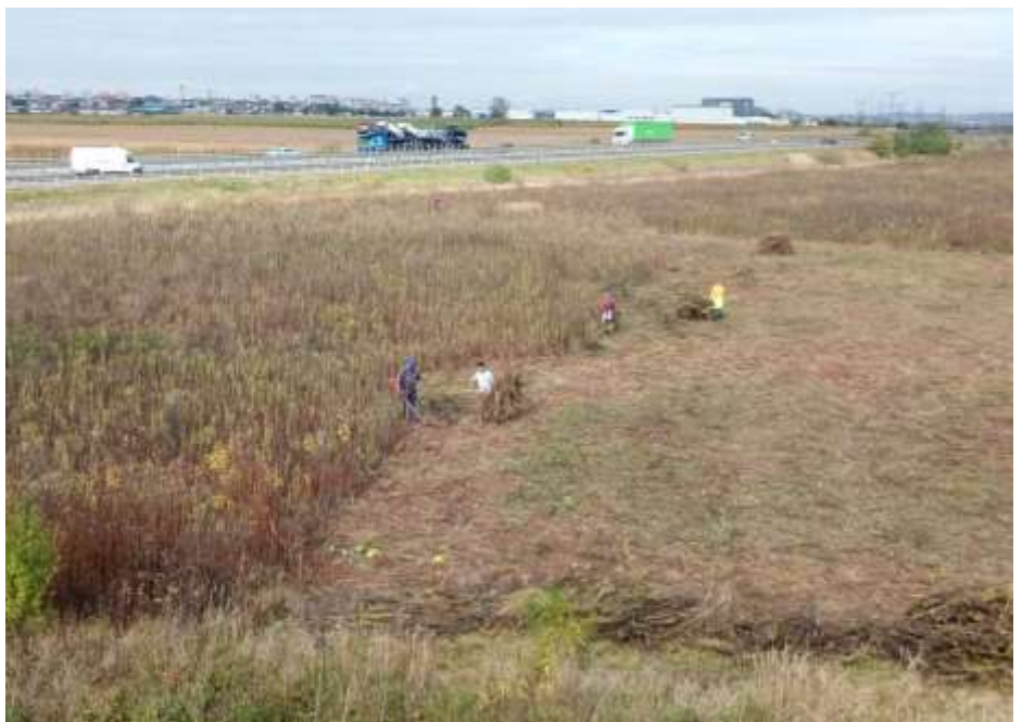
Die erste Arbeit im künftigen Kirchenwald bestand darin, die meterhohen Disteln zu entfernen, um Platz für die kleinen Setzlinge zu schaffen.

Pflege- und Ergänzungsarbeiten im Verlauf von 6 Jahren, wie auch eine jährliche Zahlung für CO 2 -Einspeicherung in den Wald im Verlauf von 20 Jahren.