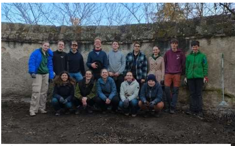
Erfreuliche Unterstützung: Schüler & Lehrer des Evangelischen Seminars Blau-beuren waren ein paar Tage zu Gast bei ihren ehemaligen Schulkollegen – an einem der Tage schafften sie Großartiges: nämlich den Hof der Hammersdorfer Kapelle von Unmengen Dachziegeln und Baumaterial zu leeren.

Wir waren von August 2024 bis August 2025 im Rahmen des Internationalen Jugendfreiwilligendienstes mit dem Gustav-Adolf Werk Württemberg, unserer Entsendeorganisation, in der Gemeinde tätig. Grundsätzlich waren wir an zwei Tagen in Hammersdorf, ein Tag im Pfarramt und einen in Schellenberg eingesetzt. Den