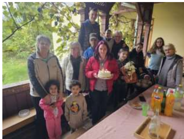
Eine Geburtstags-Torte auf der Terasse des Diakoniehofs

Freiwillige aus Deutschland und der Schweiz unterstützten die Arbeit, u. a. bei Renovierungsmaßnahmen in der Kirche. Zudem nahmen Kinder und Mütter mit Unterstützung des Vereins Mathilda-hilft aus der Schweiz am Weihnachtsmarkt teil.