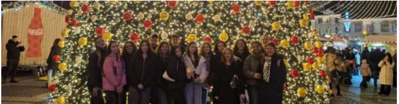
Besuch der Mediascher Jugendgruppe: zusammen mit den Hermannstädtern macht man den Weihnachtsmarkt unsicher

In dieser Zeit fanden wöchentliche Treffen im Jugendraum statt, an denen im Schnitt 15 der 20 Mitglieder der Jugendgruppe teilnahmen. Unsere Gruppe besteht aus Jugendlichen im Alter von 15-19 Jahren, also Schülern. Bei diesen Treffen wird immer ein thematischer Impuls gegeben auf den eine Andacht aufbaut. Anschließend werden die angesprochenen Themen in der Gruppe diskutiert und vertieft. Das gesellige Zusammensein im Anschluss festigt das Gemeinschaftsgefühl und motiviert die Jugendlichen, sich in die Jugendarbeit einzubringen.