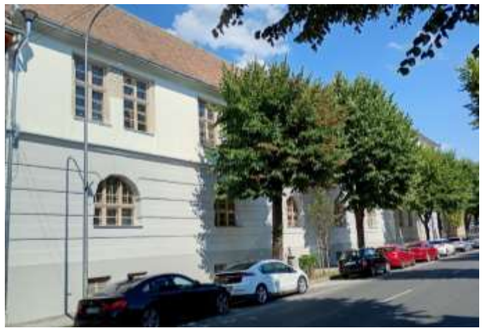
Liceul Agricol - ehem. Mädchengymnasium - Fassade Gebäudetrakt Str. Banatului

Am Hauptgebäude wurde der zweite Teil der Fassade renoviert, sowie die Fenster repariert. Die grundlegende Renovierung der Sporthalle ging weiter: Der Dachboden wurde abgedichtet, es wurden neue Elektro- Sanitär und Heizungsinstallationen eingebaut, Fenster und Eingangstüren ausgetauscht, einige Räume neu aufgeteilt, eine Brandmeldeanlage eingebaut.