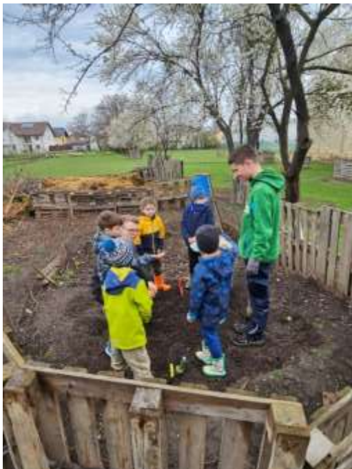
Grüne Woche am Diakoniehof Schellenberg - hier werden all die kleinen Lebewesen des Komposthaufens erkundet

Die diakonische Arbeit im Jahr 2025 wäre ohne Spenden, ehrenamtliches Engagement sowie die Unterstützung von Partnern und Förderern nicht möglich gewesen. Allen Beteiligten gilt ein herzlicher Dank.