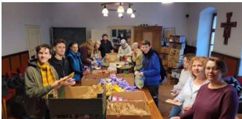
Päckchenpacken im Presbyterialsaal

gebacken. Drei Tage später wurden Geschenkpackchen gepackt für 170 Kinder; 174 Senioren und 106 Bewohner des Dr.-Carl-Wolff-Heims.